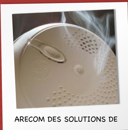
ARECOM DES SOLUTIONS DE