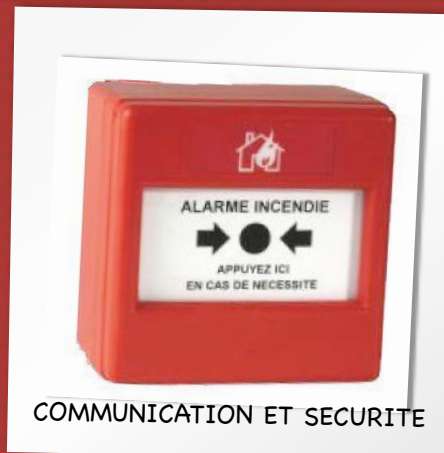
COMMUNICATION ET SECURITE